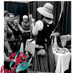
Salon DES ARTISTES ET DES ARTISANS DE LA MATAPÉDIA

La 19 e édition du Salon des artistes et artisans de La Matapédia a permis à 40 exposants de la région de mettre en valeur leur savoir-faire et de permettre aux visiteurs de dénicher des produits originaux que ce soit pour offrir en cadeau ou simplement se faire plaisir. Cette rencontre annuelle se veut également être un lieu de rassemblement, de partage et d'échange entre les citoyens de La Matapédia.