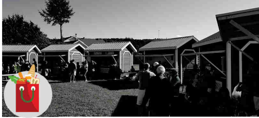
Marché Public MATAPÉDIEN

Depuis plusieurs années, la SADC accompagne les membres du conseil d'administration du Marché public matapédien autant techniquement que financièrement. La tenue d'un marché agroalimentaire estivale contribue à la croissance des entreprises de La Matapédia en leur permettant d'avoir accès à une mise en marché de circuit court peu coûteuse et bien structurée. Les consommateurs démontrent de plus en plus d'intérêts envers les produits locaux. Nul doute que le Marché public matapédien se doit de faire partie du portrait socio-économique du territoire. C'est pourquoi, la SADC de La Matapédia souhaite poursuivre son engagement envers ce dernier.